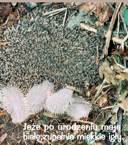
Jeże po urodzeniu mają białe, zupełnie miękkie igły.

W razie niebezpieczeństwa jeż – jak pewnie dobrze wiecie – zwija się w ciasną kłującą kulę. W ten sposób odstrasza napastnika, bo ktoś chciałby ryzykować pokłucie nosa? Skulony jeż może trwać w tej pozycji nawet kilkanaście minut, ponieważ pod skórą na całym grzbiecie ma specjalny mięsień służący do zwijania się w idealną kulę.