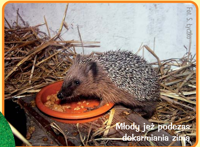
Młody jeż podczas dokarmiania zimą