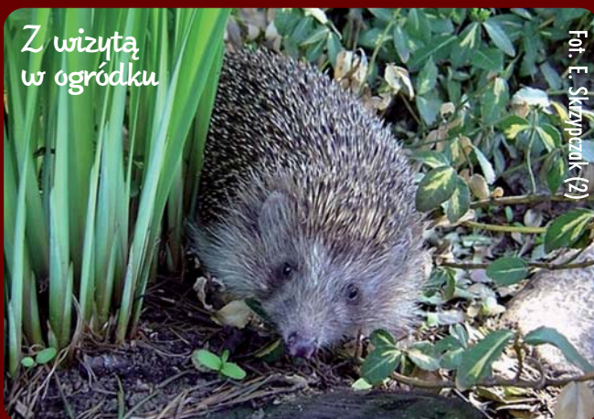
Fot. E. Skrzypczak (2)

Jeże to pożyteczne zwierzęta. Oczyszczają środowisko z drobnej padliny oraz wyjadają młode myszy i szczury z ich gniazd. Są też nazywane pomocnikami ogrodnika, ponieważ chętnie jedzą ślimaki.